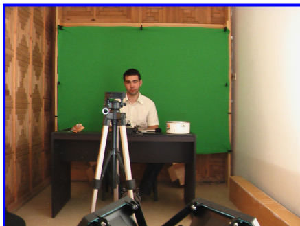
Prvé natáčanie v G15