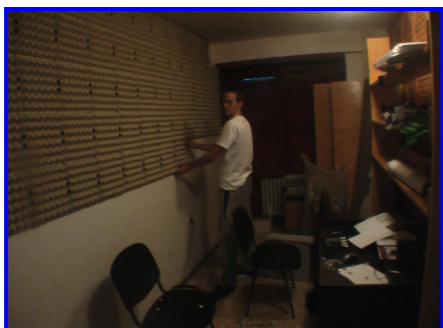
Lepenie akustickej steny