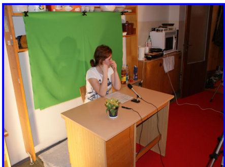
Prvé natáčanie v G704