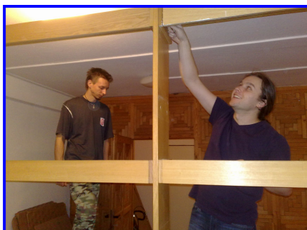
Stavba štúdia – deliaca priečka