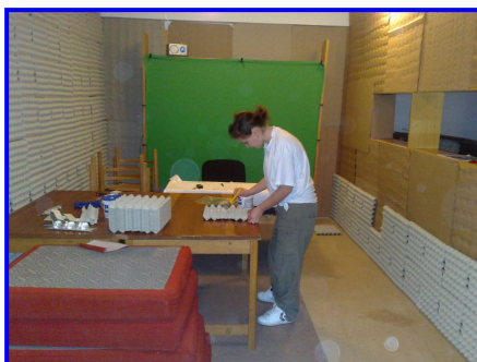
Lepenie akustického obkladu